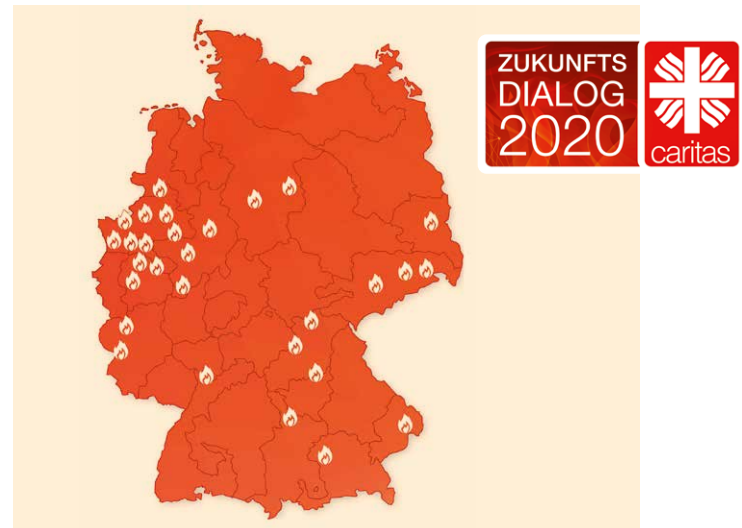
Stationen der Feuer&Flamme-Tour

Raumwahl hatten maßgeblichen Einfluss auf Ablauf und Inhalt der Veranstaltungen. Insgesamt fanden 35 Veranstaltungen in Ost und West, Nord und Süd statt, in Turnhallen, Stadthallen