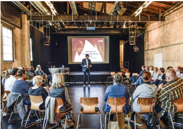
In einer ausgefallenen Location, einem Kulturhaus mit großem Saal und Bühne, waren alle Mitarbeitenden des Caritasverbandes Arnsberg-Sundern im Oktober 2019 eingeladen, miteinander ins Gespräch zu kommen.

Die Caritas als hierarchisch gegliederte Organisation ändert ihre Organisationsstruktur, baut netzwerkförmiges Arbeiten aus und bezieht unterschiedliche Blickwinkel des gesamten Verbandes mit ein. Damit werden bisher eher abgegrenzte Ressourcen und Potenziale gehoben und gesamtverbandlich nutzbar und wirksam.