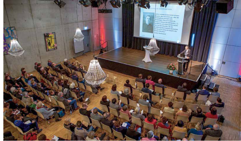
Rund 150 Führungskräfte aus Caritasverband, Fachverbänden, Einrichtungen und Diensten in der Erzdiözese München und Freising diskutierten im Januar 2020 wichtige Zukunftsfragen im Kulturhaus Milbertshofen in München.

Eine fest fundierte Werteorientierung ist angesichts eines rauer werdenden gesellschaftlichen Diskurses und zunehmender Individualisierungstendenzen in der Gesellschaft unabdingbar. Auch im Hinblick auf den steigenden Bedarf an Gemeinwohlorientierung und auf die dringend notwendige ökologische Transformation unserer Welt sind fest verankerte Werte ein Fundament, auf dem sich weiterhin aufbauen lässt. Gerade in Zeiten tiefgreifenden Wandels sind Reflexion, Weiterentwicklung und Adaption von Werten notwendig und gleich-